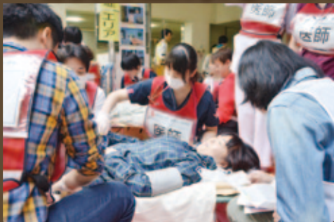
3月14日(土) 院内で災害訓練を開催。多数傷病者の受入や担架搬送など実践的な訓練を実施