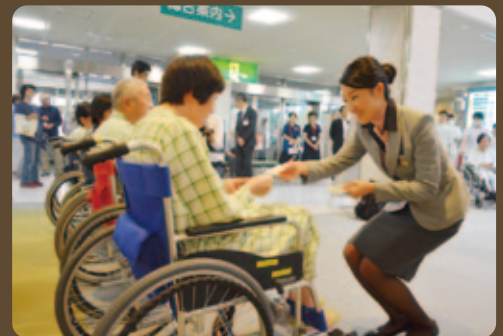
6月3日(水) ANA(全日空)様より、「幸せ」の花言葉をもつすずらんの花としおりを届けて下さいました