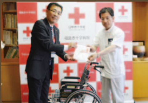
6月3日(水) 株式会社ヤナセ様より同社の100周年記念事業として、車椅子5台を寄贈いただきました