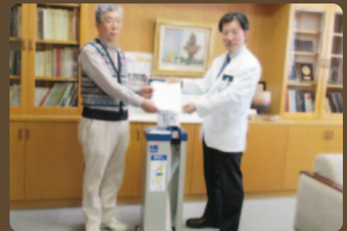
4月23日(木) 株式会社セクテス様より、傘袋装着機「傘ぼん」と傘袋1万枚を贈呈いただきました