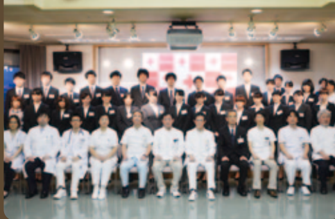
4月1日(水) 辞令交付式が執り行われ、35人の新入職員が仲間入りしました