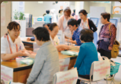
5月12日(火) 赤十字運動月間・看護の日イベントを開催。健康相談など盛りだくさんの内容で大好評!